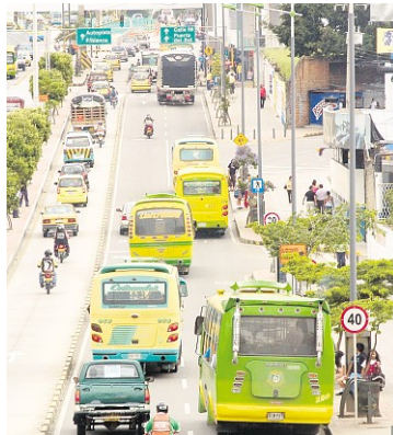
Sobre la carrera 15, así como en la 27 y 33, no hay bahías para los buses. Esta sería una de las razones por las que a futuro habría más congestión vial. Con el sólo hecho de que un bus pare en la arteria, reduciría el 50% de la capacidad de esa vía.

¿Por qué no estudian alternativas viales y las implementan? Porque sencillamente la ciudad tiene limitaciones en las vías.