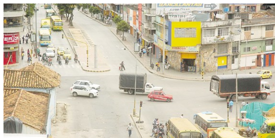
La glorieta de la Avenida Quebradaseca con carrera 15 está en proceso de licitación y próxima a ser adjudicada. Los especialistas en tráfico advierten que ésta no sería una solución de movilidad. El mismo llamado lo ha hecho la Asociación Colombiana de Taxistas y Conductores del Servicio de Transporte Público.